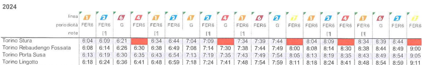
Figura 1 | orario Torino Stura (2023/2024)